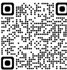
Bilovice n. S. 3/2024