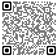
Ochoz u Brna