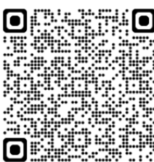
Babice n. S. 3/2024