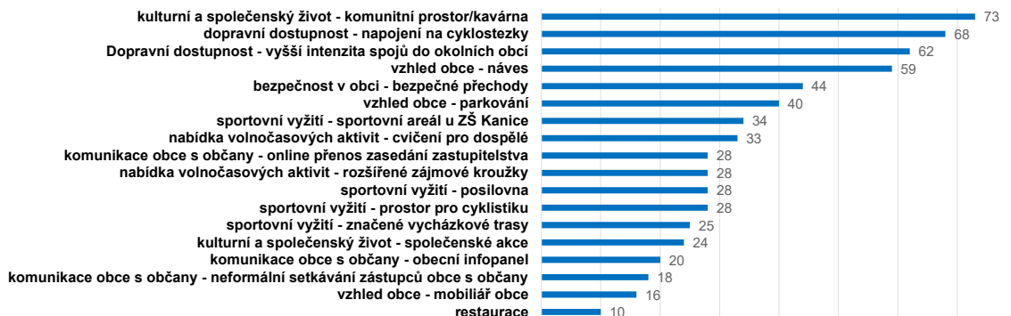
obr. 3 V čem by se Kanice mohly zlepšit?

Ráda bych znovu poděkovala všem, kteří se zapojili do dotazníkového šetření a poskytli tak cenné podněty a názory. Pracovní skupině FFC děkuji za veškerý čas a energii, které projektu věnovali!