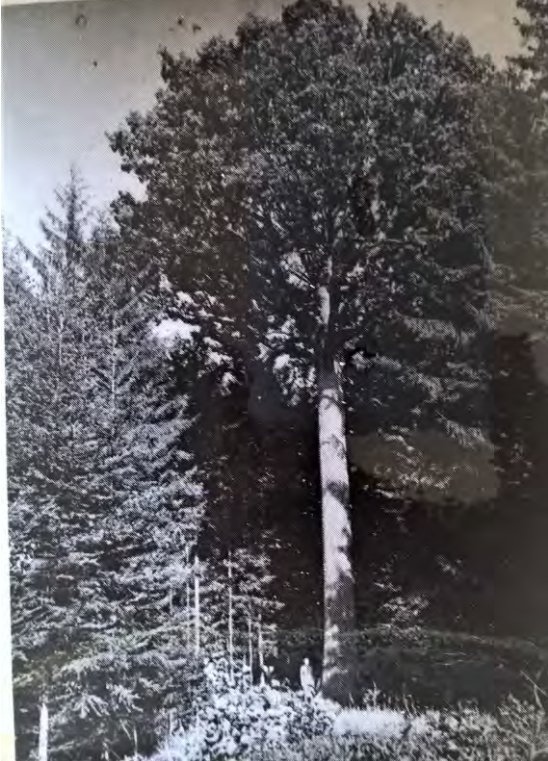
Kulatý dub ve své největší slávě.

Za mého mládí to byla atrakce. Žádná škola v okolí neopomněla pořádat k tomuto mystickému stromu každý rok „pochodák“, aby i děti uviděly a poznaly tu obrovskou krásu. Když stál, byl to