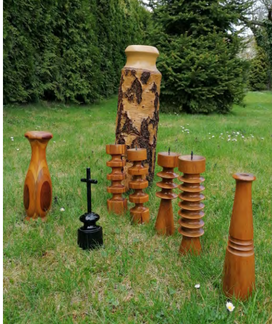
Ukázka precizní soustružnické práce.

Abychom si uvědomili ojedinělost a význam dřevosoustružnické produkce firmy, je nutné se zmínit o sortimentu, který byl velmi žádaný v rámci celého tehdejšího Československa. Výroba začínala v době významných společenských změn, měnících se hodnot a nového životního stylu. S masivním nástupem zájmových a sportovních aktivit a související novou úrovní oblékání vyvstala potřeba tělocvičného nářadí a věšáků na oděvy. Dílna tak dodávala organizacím Sokol a Orel cvičební nářadí. Velká poptávka byla zejména po dřevěných 1 m dlouhých jasanových tyčích, kterých se v Kanicích vyráběly tisíce. Tisícových objednávek dosahovaly rovněž cvičební kužele, ovšem naprostý věhlas si získaly soupravy kruhů na cvičení, sestávající z válce, vodčíc kladky a vlastních kruhů. Zcela unikátní výrobní technologie tohoto náčiní neměla nikdy